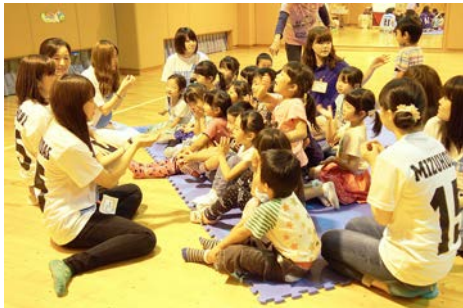
まずは手遊びで仲良くなりましょ♪