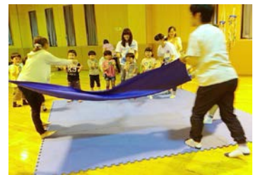
ピョンピョンガエルをびよ～ん！