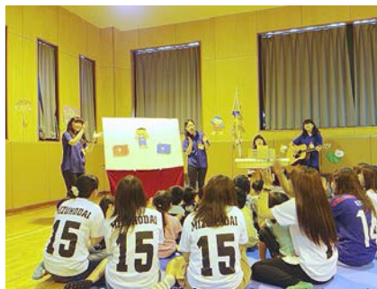
パネルシアターサークル『ピタペタ』の生演奏付パネル！