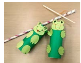
心を込めて作りました♪