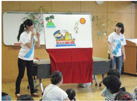
『とんでいったバナナ』歌に合わせて楽しく★

7月2日(木)、わくわく遊び隊のメンバーの1年生5人が、富士見市子育て支援センター『ぴっぴ』の七夕イベントに参加させていただきました！子育て支援センターは、主に乳児親子が利用する施設です。今回、遊び隊のメンバーは一生懸命練習したパネルシアターを2作品披露しました★