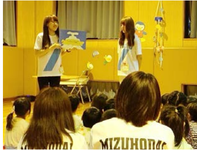
たくさん練習しました！紙芝居★