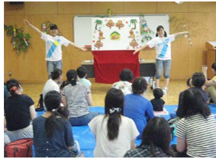
『アイアイ』リズムに乗って！ポーズも決まっています