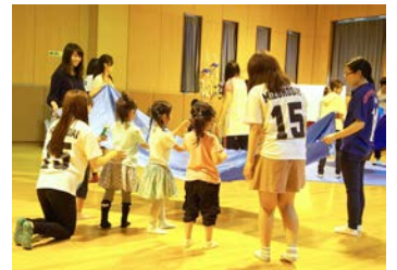
水色の布を池に見立てて、びよ～ん！