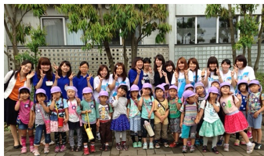
帰る前にみんなで記念撮影★ また来てね！