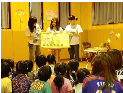
大型絵本は3人で役を分けて読みました