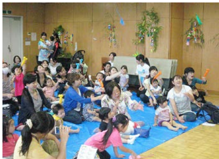
作った風船のネズミを飛ばしてピョーン！！