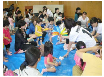
風船人形づくりも一緒に楽しみました