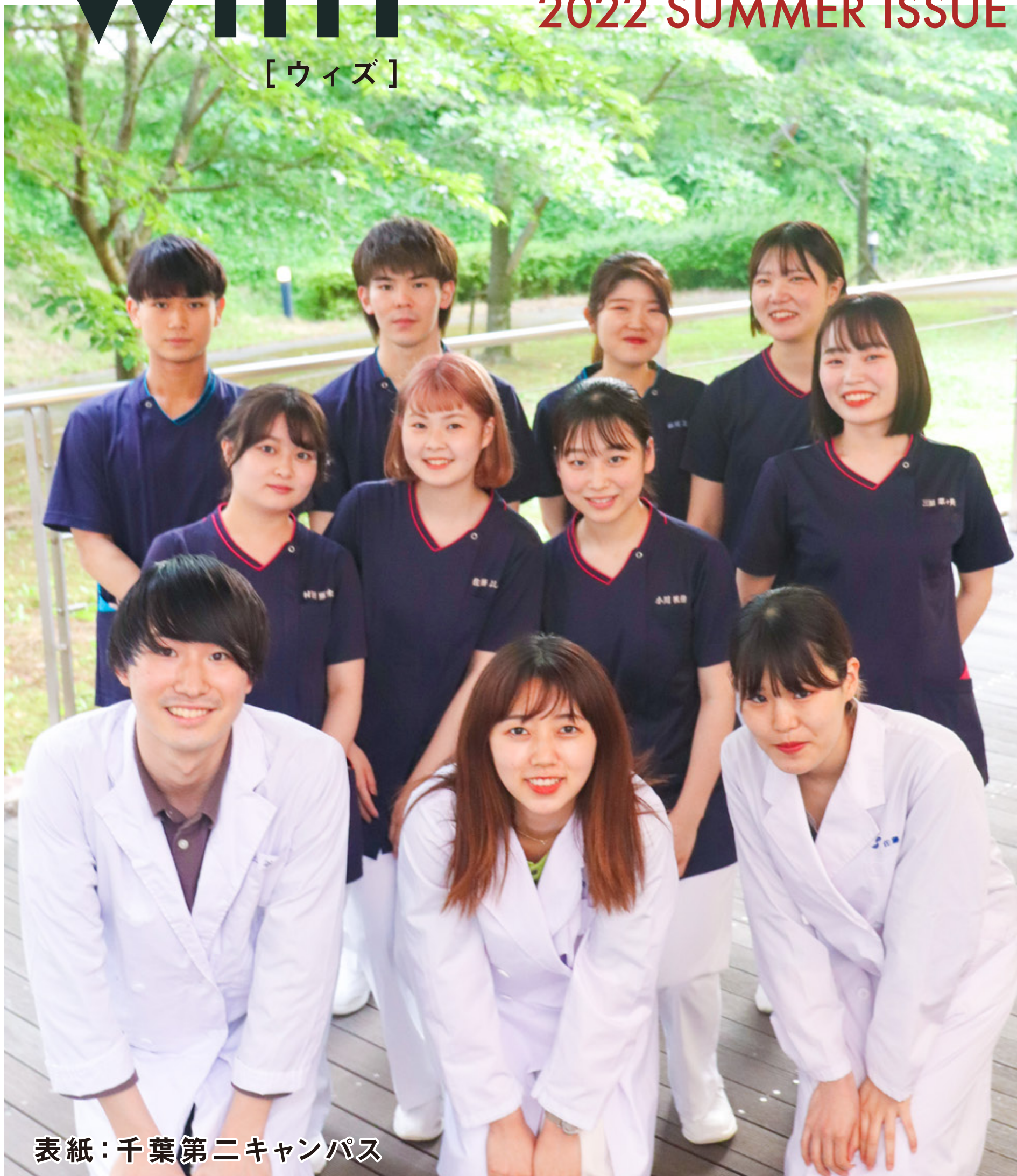
表紙：千葉第二キャンパス