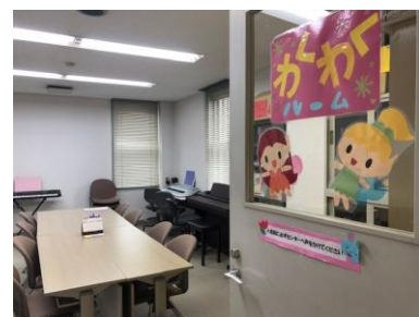
実技練習“わくわくルーム”