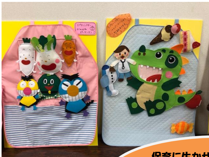
エプロンシアター