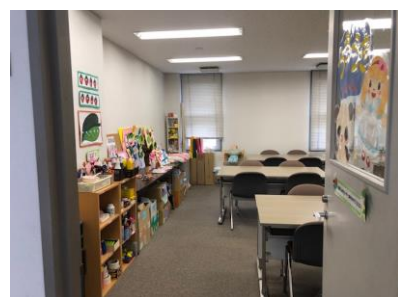
製作“うきうきルーム”