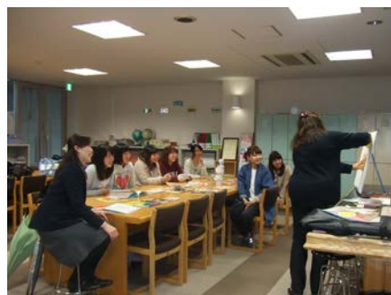
空き時間にスキルアップ