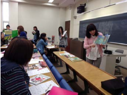
絵本の読み聞かせ