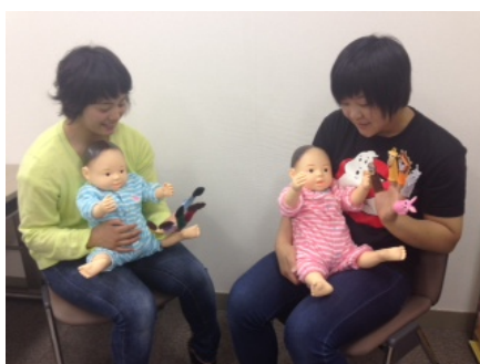
しょうちゃん&ゆめちゃんと