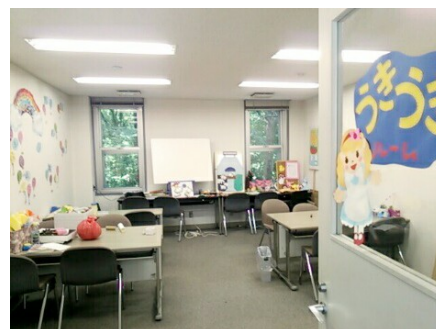
製作の部屋 “うきうきルーム”