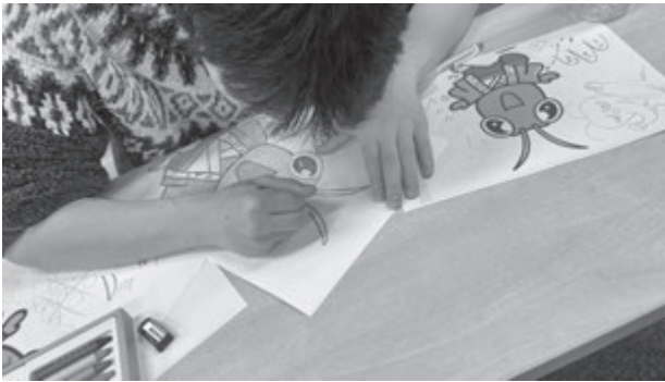
写真1 フォトフレームの作成