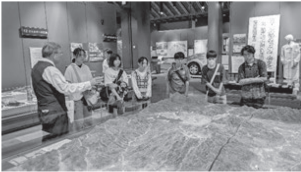
福島県立博物館の展示見学

になった文化財の特徴や価値を学び、それを紹介する展示コーナーの設営作業や型彫り体験のワークショップに取り組んだ。最終日は会津若松市に移動して、福島県立博物館や会津若松城（鶴ヶ城）跡、七日町通りなどの歴史的な文化遺産を活用した観光のあり方について巡検しながら学んだ。期間中には、喜多方市で文化庁の100年フードに認定されている喜多方ラーメン、山都そば、塩川鳥モツを味わうなど、地域の食文化についても触れる機会が多くあった。現地実習終了後の事後学修では、これまでの成果から学んだことのまとめを行い、それをふまえて考えたことについてレポートを作成した。