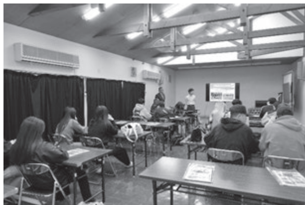
三芳町農業センターでお話を聞く

ジャパングーデンツーリズムは、オープンガーデン、オープンフォレスト、オープンファームから成り、様々な施設やイ