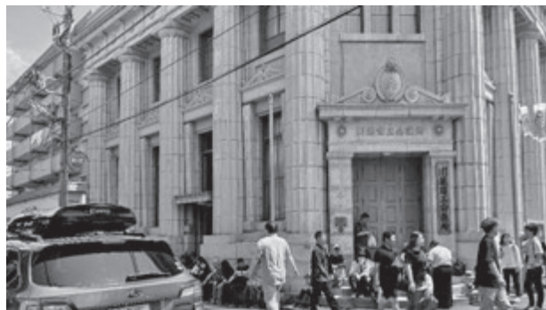
写真2 川越商工会議所2025年5月4日

また、二度の川越町歩きが、ゴールデンウィークの混雑時と5月下旬の閑散期に分かれたことで、同一地点の変化を分析に反映したレポートを作成することができました。最終的に選ばれた写真(写真2)には「そこに“座ってた”理由」というタイトルで約400字の物語を付与しました。これは、クラスの中で最終的に選ばれた1枚ということになります。