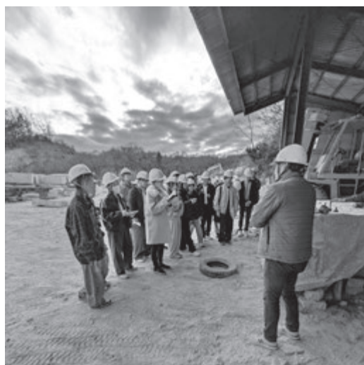
(友常石材での見学の様子)

地元の企業は人々の生活を支えるインフラでもあることを学ぶことができました。また、同様に、地元の企業が作り出す笠間の稲田石は、高い職人技術により品質管理をされていること、そして、笠間の近代史を映し出していることも理解することができました。