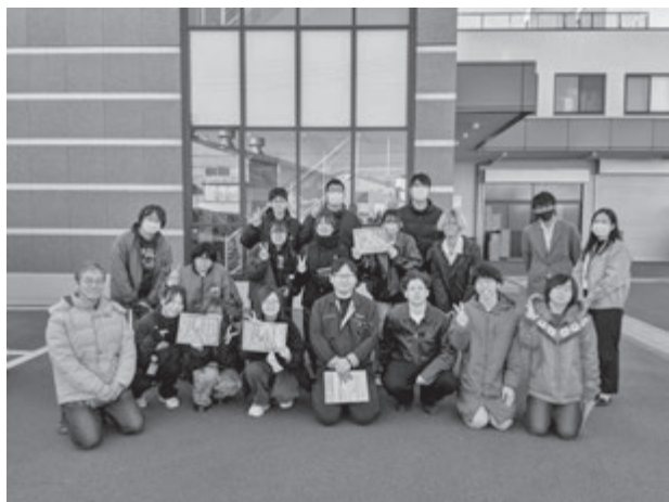
【実習Ⅳの様子(沼澤製作所にて記念撮影)】

実施し、川(水)と文化財との関係をテーマに複数の地区を巡った。現代の地図と江戸期・明治期の地図を見比べながら巡検を行うことで、河川改修や土地利用の変化が集落構造や信仰、文化財の立地にどのような影響を与えてきたのかを具体的に理解することができた。水害と向き合いながら生活を築いてきた地域の歴史は、八潮市に限らず他地域を考える上でも重要な視点を提供するものであった。