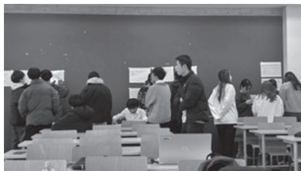
調査票作成の様子2026年1月27日

社会調査士B科目に照らすと、本演習で扱わなくてはならない項目には「調査目的と調査方法、調査方法の決め方、調査企画と設計、仮説構成、対象者の選定方法、サンプリング法、質問文・調査票の作り方、調査データの整理など」です。これを講義科目として展開する授業が他大学では多いように思いますが、本演習では「地域創生学部学生調査」の一環として、実践的に理解してもらう工夫をしました。