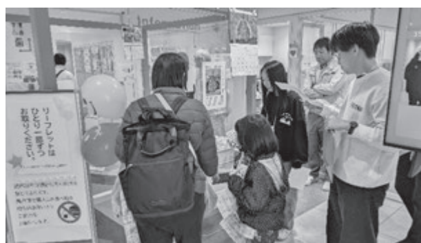
とみおかアーカイブ・ミュージアムでのイベント対応