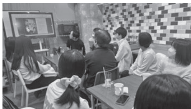
写真2 PALCAFEでの東みずほ台商店会の方とのイベント振り返り(2025年10月28日)

イベント終了後には、PALCAFEにて東みずほ台商店会の皆様とともに、Instagram上で開催された仮装コンテストの投稿写真から最優秀仮装者を選定しました(写真2)。選考では「みずほ台のお店を多くの人に知ってもらい、地域全体を盛り上げることを重視しました。この検討を通じて、イベント運営の成功点や課題について振り返る時間を持つことができました。