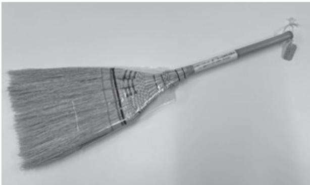
写真5 ほうき作り伝承会寄贈の座敷ほうき

学外での地域実習としては10月10日(金)に「水子貝塚公園(資料館)」を、10月31日(金)に「難波田城公園(資料館)」を訪れました。これら2つの公園を訪れる前に、学生たちは市制50周年記念誌『富士見のあゆみ』を学生たちで輪読して、事前学習を行いました。