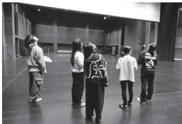
さいたま芸術劇場の舞台上