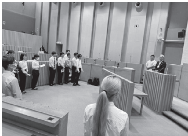
写真1 富士見市議会議場における星野富士見市庁様、勝山市議会議員からのレクチャーの様子

えいただき、住民代表としての議員の活動、議会の役割について理解を深めることができました。その後、場所を移して、政策企画課の担当者から総合計画などについて授業をしていただき、また、市の統計情報を用いて富士見市の地域課題について学習しました。最後に、公共施設マネジメント課の方のご案内で市役所内を見学させていただき、市役所内の行政機構の配置や、住民サービス提供の実態について視察を行いました。現在、市では新庁舎整備の検討がなされていますが、現行の市庁舎は職員の執務環境や住民サービス提供に支障を来している実情を把握しました。