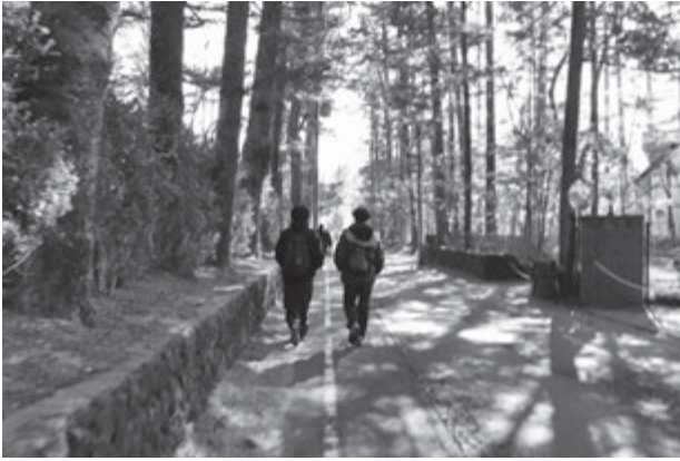
【別荘地の中を徒歩にて移動】