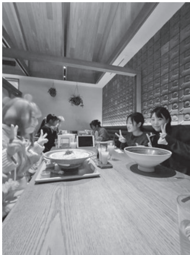
【Tsuru Ton Tan 軽井沢店での昼食】(学生提供)

旧軽井沢では、カトープレジャーグループが運営するTsuru Ton Tan 軽井沢店および「ふふ旧軽井沢 静養の森」を見学した。店舗および宿泊施設の空間設計やサービスの在り方から、軽井沢というブランドイメージをどのよ