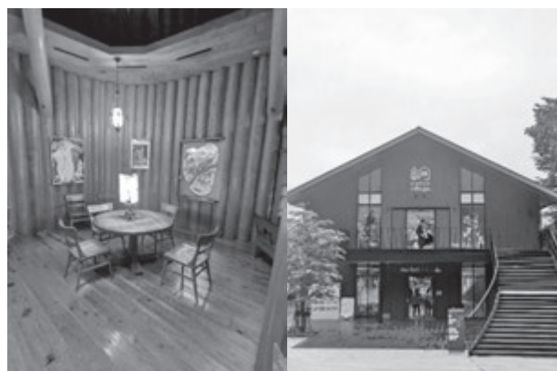
(あけぼの子ども森公園とメッツァ)

現地実習は5月10日(土)に飯能市を訪問し、見学実習を行いました。全体を半分に分け交代で飯能市のあけぼの子ども森公園、飯能市街地、メッツァを訪問しました。事前に調べ作成した見学実習ルートをもとに、飯能市の3カ所を各班毎に訪問しました。