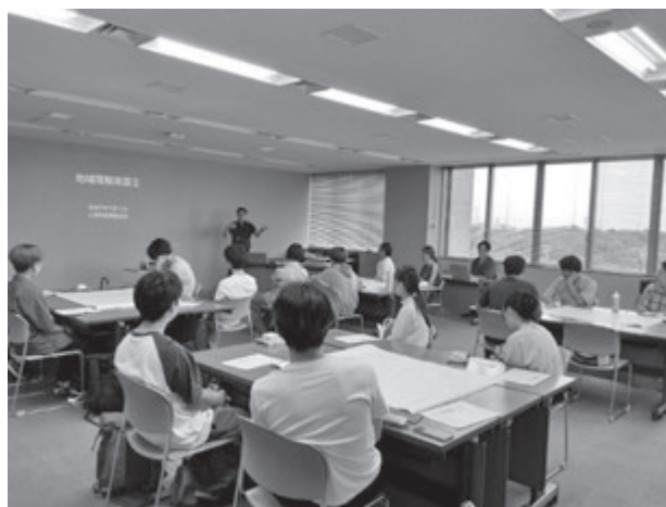
三芳町役場での実習の様子

事前学習で第6次総合計画について調べましたが、講義とグループワークを通して、さらに三芳町の抱える問題や課題について学ぶことができました。