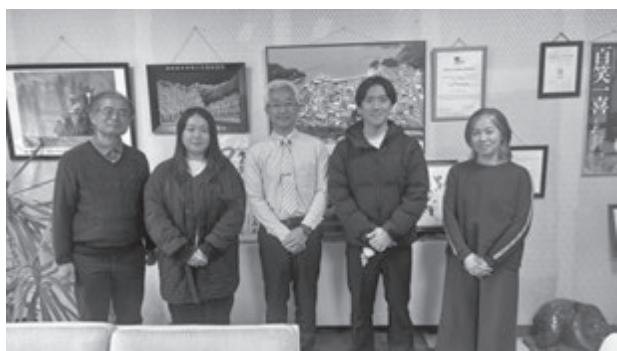
写真4 深澤準弥町長との記念撮影(2025年12月18日)

そのため、松崎町教育長や企画観光課まちづくり推進係係長の方にもインタビューする機会をいただきました。様々に移住推進策を進めている中での実情や、企画観光課の仕事内容について伺い、松崎高校の位置づけについて考えました。