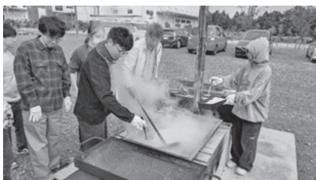
とみおかアーカイブ・ミュージアムでの塩炊き体験

現地実習は11月5日(水)から9日(日)の計5日間実施した。実習の拠点として受け入れていただいたのは富岡町の「とみおかアーカイブ・ミュージアム」で、同施設では3日間の実習を行った。初日に常設展示および収蔵庫などのバックヤードを見学し、併せて震災後に進められてきた文化財レスキューや震災遺産の保全などの多様な博物館活動についても学ぶことができた。また同施設では昭和の塩炊きワークショップを準備から片付けまで通して体験した。富岡町は縄文時代から海水を使った塩作りをしていたことが遺跡から出土した製塩土器などから分かっており、昭和時代まで現金収入源として塩がつくられていた。今回は富岡漁港から採取した海水を塩釜で煮詰め、さらに七輪で炒って塩をつくるというかつての塩づくりの工程を体験的に学んだ。また同施設に隣接する富岡町文化交流センター「学びの森」で開催された「とみおか秋まつり(えびす講市)」に合わせて、えびす講市の歴史を紹介する展示とクイズイベントが開催されたが、その展示設営の補助や来館者へのイベント対応などの仕事を担当学芸