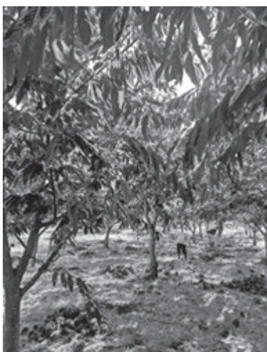
(栗拾い体験の様子)

午後からは、かねこ農園にて栗の栽培や観光農園について講義を受けるとともに栗拾い体験をしました。栗の収穫は機械を使うことが難しく手作業となり、また収穫をした後も大きさや品種を分類する必要があります。栗のいがを踏んで、そこから栗の実を取り出す作業を体験することができました。