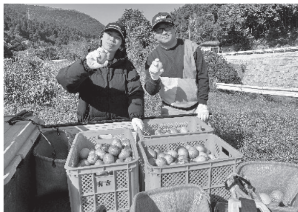
【ゆず収穫体験(農家民宿班)】

また、自給自足的な生活については、「自分で育てて食べることを初めて実感した」「都市生活では感じられない達成感があった」という声が挙がった。一方で、「若い担い手がないことが不安である」「山を維持するには体力が必要であり、人手不足は深刻である」といった課題認識も共有された。