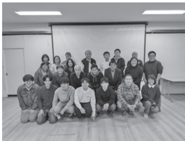
【報告会后、集落のみなさんとの記念写真】

滞在型実習により、学生は地域の生活時間を共有することができた。ヒアリングと参与を組み合わせた設計は有効であった。一方で、提言を実装段階まで踏み込めなかつ