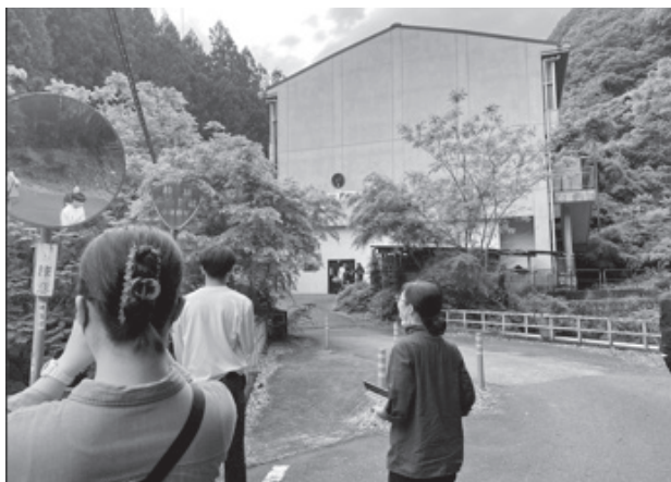
写真2 廃校舎を活用した蜂蜜酒MEAD醸造所訪問の様子