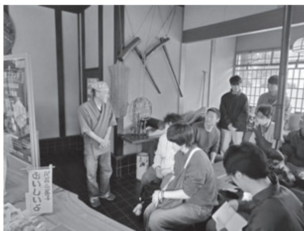
【実習Vの様子(菓子道楽軒屋にて)】

続いて、小松菜パウダーを活用した商品開発を行っている地域事業者への聞き取りを実施した。はじめに訪問し