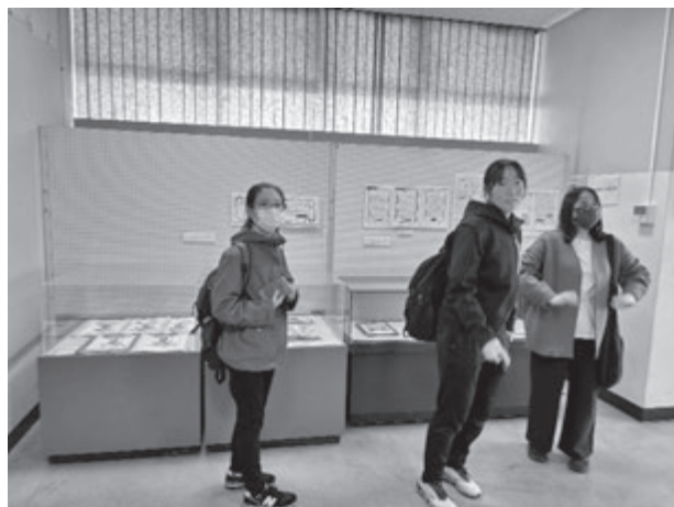
ふじみ野市立上福岡歴史民俗資料館での見学の様子

11月28日(金)は、ひたちなか市の市民交流センターひたちなか・ま、ふぁみりこらぼ(子育て支援・多世代交