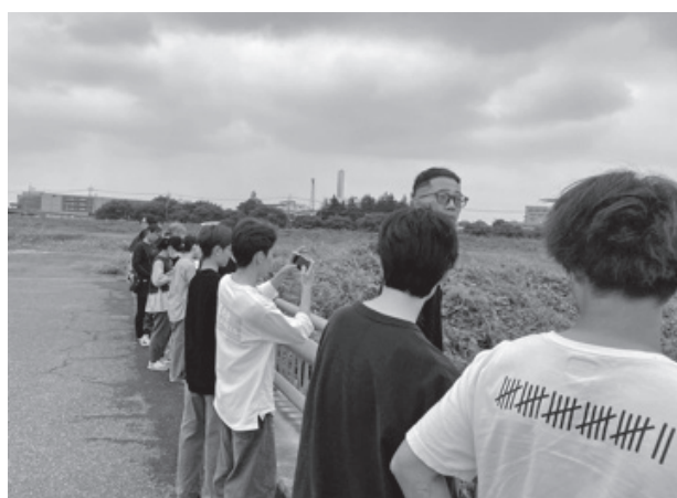
写真3 蛇島調整池訪問の様子

このほか、6月13日(金)には地域理解実習Ⅲにおいて地域の伝統的地場産業を学ぶために使用するハウキモロコシを育成するほ場の開墾と播種作業を全員が力を合わせて行いました。