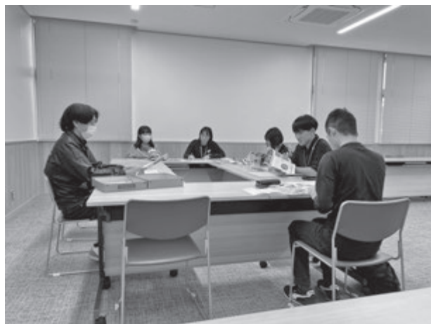
写真1 小鹿野町役場でのオリエンテーション、地方自治研修の様子

今般の実習では、所期の計画どおりに実習を行い、実習生が卒業後も地域振興の即戦力人材として活動することができるよう地域に向き合う心構えや職務に臨む姿勢を身につけることができました。実習生の安全管理、健康管理を適切に行いつつ、現地での実習を効果的、効率的に進めていくことができるよう、不断の改善を怠ることなく続けていくことが不可欠であると考えます。