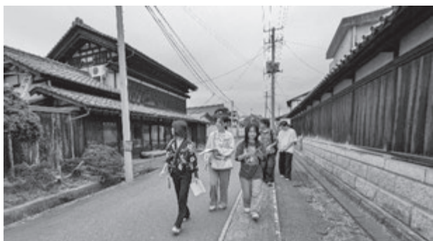
小田付地区の町並み巡検

現地実習は9月24日(水)から28日(日)の計5日間実施した。主に福島県の指定文化財である藍染めの型紙「会津型」や重要伝統的建造物群保存地区に選定されている小田付地区の町並み整備を中心に学んだ。初日は地域計画に設定された6つの「文化財保存活用区域」を構成する主要な文化財をめぐり、2日目から具体的な取り組みを体験した。小田付地区では、町並み整備の現状や課題について現場を歩いて観察し、また行政の担当の方や保存会の方、地域住民の皆さんから貴重なお話をうかがうことができた。会津型については近年の調査で明らか