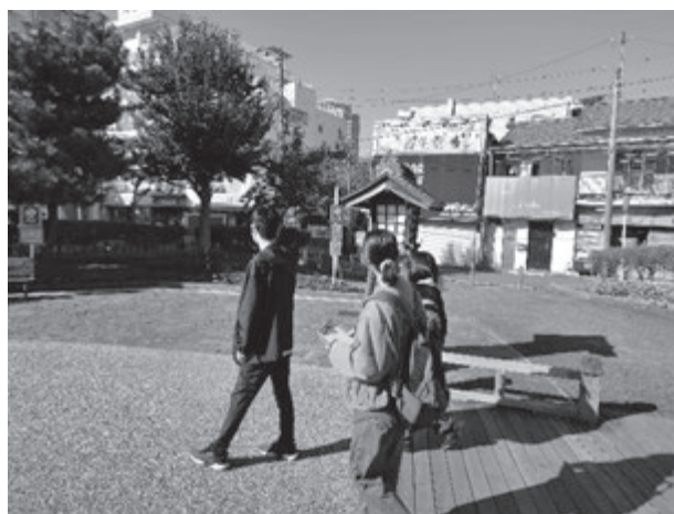
(天王町駅周辺の再開発地域を散策する学生たち)