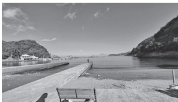
写真2 「伊豆半島の海岸沿いの町」2025年11月20日

また、実習最終日には、松崎町企画観光課の方や農園の方に同席いただき、実習経過報告会を開催させていただきました。