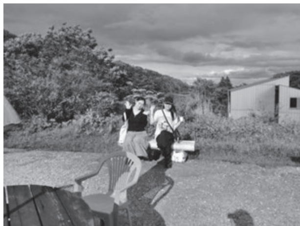
【神津牧場で名物ソフトクリームを堪能する学生】