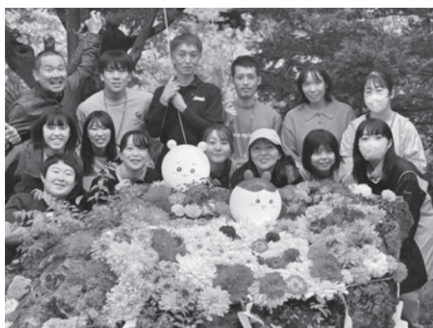
写真2 観光展示に係る活動の様子