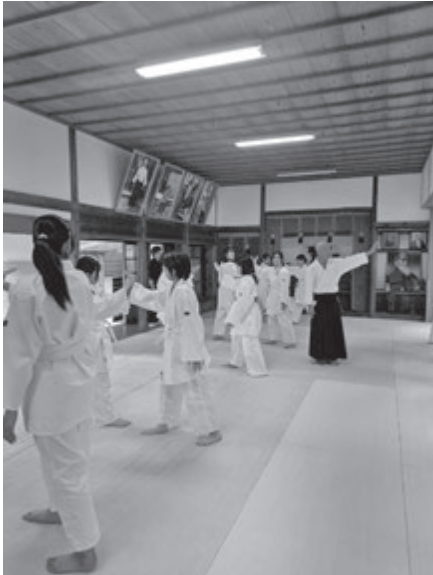
(合気神社での合気道体験)

今回の実習では、笠間市の一部である岩間地区だけでも沢山の魅力的な地域資源があると再認識することができました。