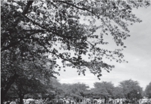
写真2 MACHifes streetのにぎわい