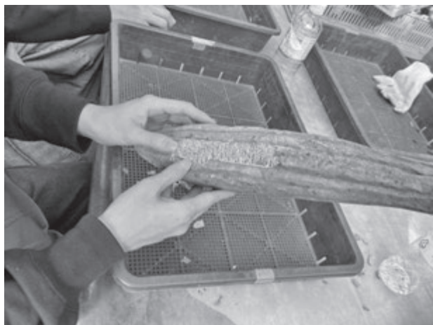
写真8 ヘチマの種取り

12月19日(金)には、みずほ台駅周辺の散策を実施しました。当日は、事前に調査したみずほ台駅周辺の土地利用の変化や、店舗・団地・農地などの立地条件を踏