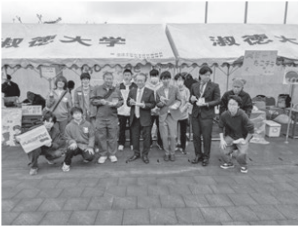
【学園祭にて大山市長との記念写真】