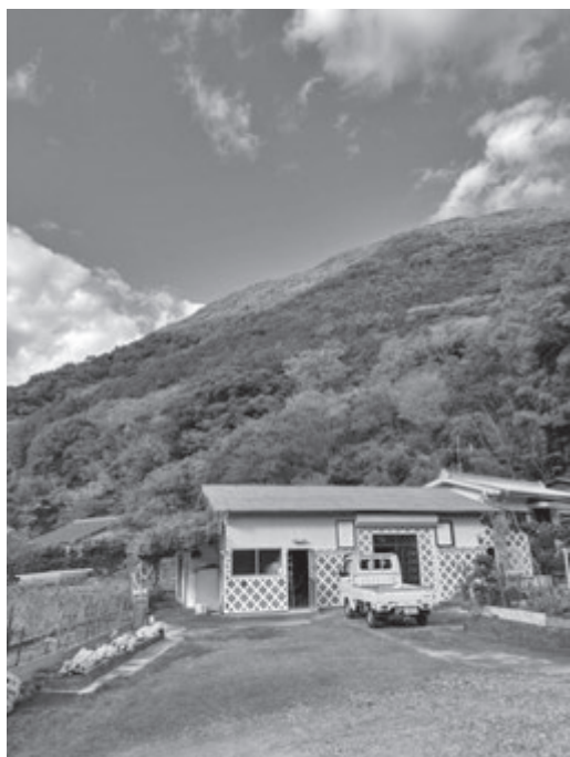
写真1 「鏝絵の継承」2025年11月19日

①農業グループ(3名)においては、移住して有機農業や稲作塾を実施している農家の方、また代々柑橘類を生産しながら町の教育にも貢献してきた農家の方にインタ