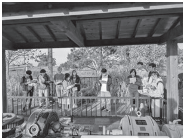
【実習Ⅲの様子(揚水機場記念ひろば)】