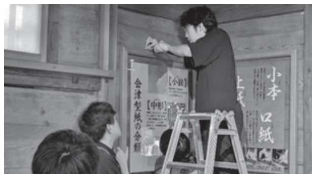
会津型展示コーナーの設営作業