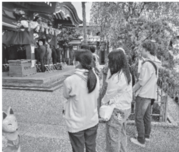
(春祈年祭を見学する学生たち)