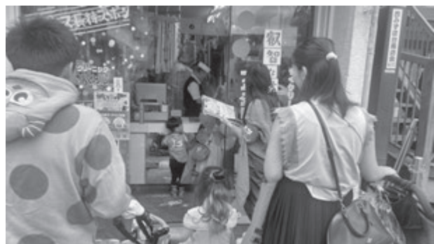
写真1 西みずほ台のクリーニング店でお菓子を受け取る子どもたち(2025年10月19日)

当日は、かわいらしい衣装を身につけた子どもたちが次々と集まり、学生の先導で各店舗を巡りながら、“Trick or Treat”と声をかけてお菓子を受け取っていました。学生たちは、年齢の異なる子どもたちの歩く速度に配慮し