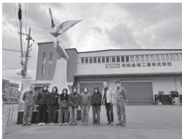
【野田金属工業にて記念写真】

午後は野田金属工業株式会社を訪問し、企業概要の説明、工場見学、意見交換を行った。同社では営業担当を置かず、技術力と提案力で受注している点や、「断ら