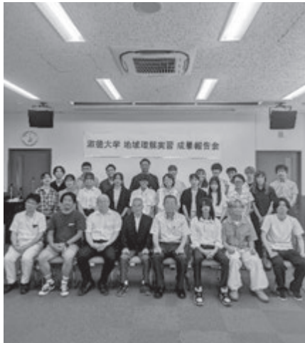
(成果報告会の様子)