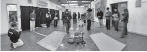
昔の遊び体験の様子