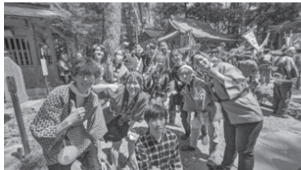
祭り当日の間々田八幡宮にて