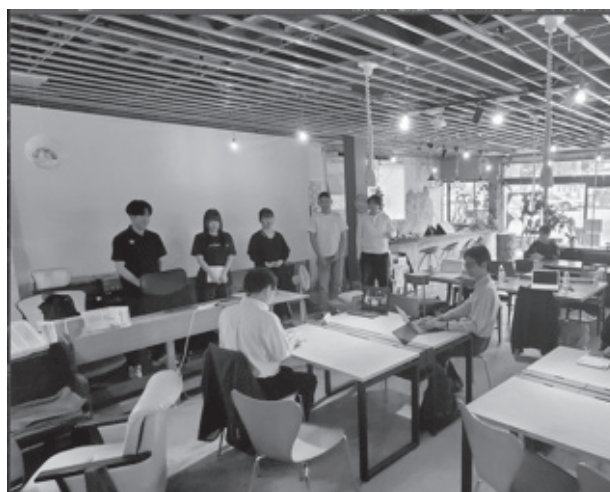
写真2 最終日の活動成果報告の様子