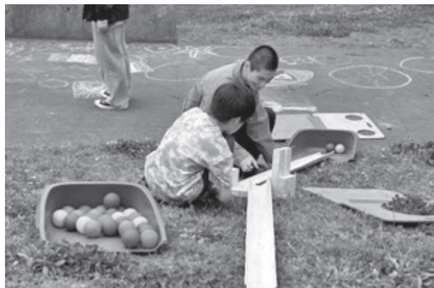
(坂道を利用したボール遊びを支援する様子)

この実習では、さまざまな地域資源がかかわる子どもの遊び場をテーマに、参与観察を行うことで、子育て家庭をめぐる地域資源について理解を深めました。それにより、非営利組織が果たす地域への役割を理解するとともに、子育て家庭をめぐる地域資源の活用状況などを学ぶことができました。