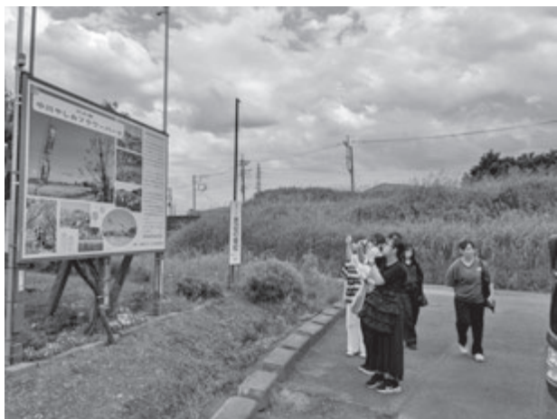
【実習Ⅱの様子(やしおフラワーパーク)】

午後は、バスおよび徒歩による市内巡検を実施した。工業団地や物流施設、農地、市街地、公園などを巡ることで、同じ市内でも地域ごとに異なる性格を持つことを確認した。とくに中川沿いの地域や駅前公園の見学では、都市近郊地域ならではの利便性ととともに、休憩施設の不足や高齢者・子どもへの配慮といった課題も見えてきた。