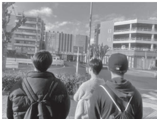
写真9 みずほ台駅周辺散策

1月30日(金)には、富士見市役所産業経済課による地域商業についての講義を実施しました。産業経済課の担当者の方から、富士見市内の地域商業の現状と課題、政策についてお話をいただきました。ライフスタイルが変化する中で、消費のあり方にも変化している実態を知ることができました。また、富士見市が取り組む地域商業政策やまちづくり政策についても理解することができました。