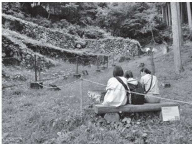
【世界遺産荒船風穴で冷風を体感する学生たち】

実習終了後、学生有志と町内の宿泊施設「下仁田館」に滞在した。実習ではないが、地元の食堂で名物のカツ