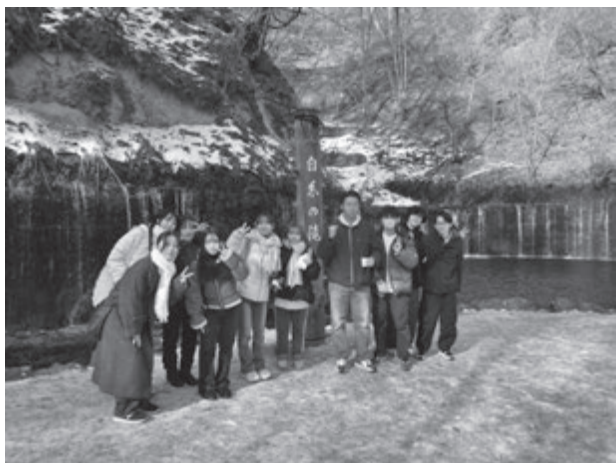
【白糸の滝にて記念撮影】

軽井沢駅到着後、草軽交通バスを利用して白糸の滝へ移動した。白糸の滝では自然景観の観察に加え、売店における土産物や飲食提供の状況を確認し、自然資源がどのように商品化され、観光消費へと接続されているかを検討した。自然そのものは無料で存在するが、その周辺に整備された販売施設や飲食サービスが付加価値を形成していることを、現地観察を通じて理解した。