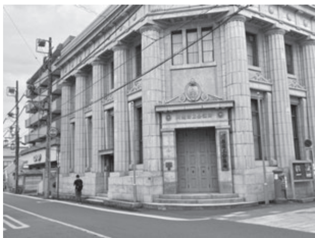
写真1 川越商工会議所2025年5月24日