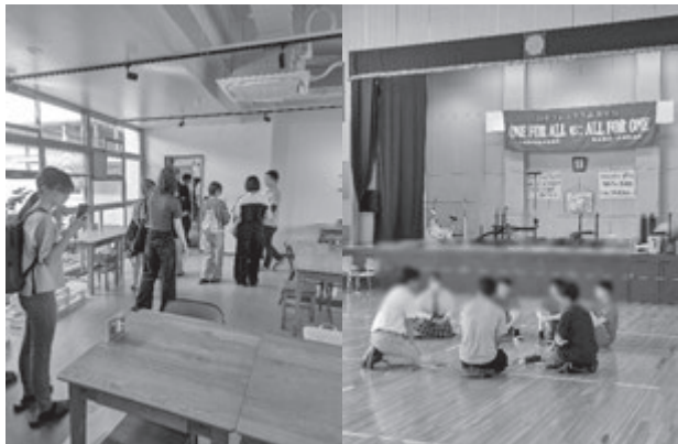
(旧東中学校・旧南小学校見学実習の様子)

「人口が減ることが問題ではなく、減ると問題になってしまう社会が問題」という笠間市の地域課題への取り組み姿勢についてしっかりと勉強することができました。