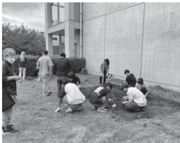
写真4 ハウキモロコシ育成ほ場開墾・播種作業の様子

このほか、6月13日(金)には地域理解実習Ⅲにおいて地域の伝統的地場産業を学ぶために使用するハウキモロコシを育成するほ場の開墾と播種作業を全員が力を合わせて行いました。