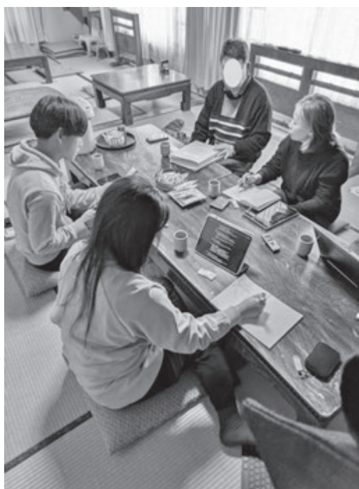
写真3 Uターン経験者へのインタビューの様子(2025年12月17日)

実習で不足と思われる情報の収集を目指すことができました。具体的には、進学や仕事で松崎町から離れ、Uターンで松崎町に戻ってきたお二方へのインタビュー(写真3)と、Iターンでライフスタイル移住を経験した伊豆まつぎ田舎暮らしサポート隊の方々へのインタビューをすることができました。11月実習からの取りこぼしとして、高校進学時から松崎町外に通学を余儀なくされるのが、松崎に愛着を持っていても、離れざるを得なくなる理由ではないかと予想して、子育てに関わっている方や、ご自身の子ども時代を振り返っていただくような聞き取りを行いました。