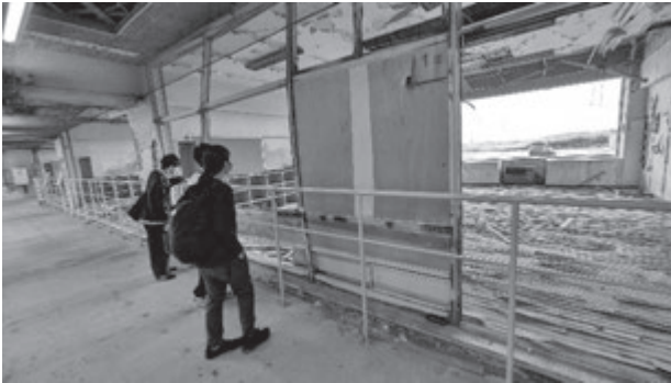
震災遺構・請戸小学校の見学