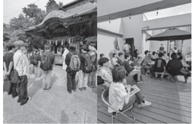
(笠間稲荷神社と門前House視察の様子)

今回の実習を通じて、あらためて笠間市が地元にある様々なものを資源として活用し、魅力的な取り組みを実施されていることを学ぶことができました。