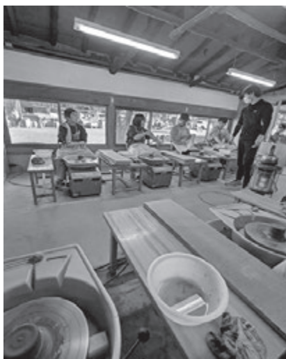
(松佐陶工房でのロクロ体験)

最後に松佐陶工房にて笠間焼のロクロを体験しました。電動式ロクロを使い、笠間の粘土を成形していきます。ほとんどの学生がはじめてロクロを体験する中で、自分の作品を完成させていきます。工房の先生が湯呑から皿まで自由自在に形を変形する様から笠間焼の技術の深さに触れることができました。