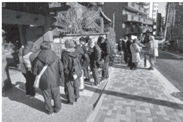
善光寺坂でお話を聞く

まち歩きのガイドは、文京ふるさと歴史館まち案内ボランティアをお願いし、コースと資料の作成、案内していただきました。コースについては、文京区の特徴がわかる場所をめぐるということで打ち合わせを行い、「文京区内徳川家ゆかりの地を訪ねる」というテーマで、傳通院、小石川後樂園、湯島聖堂などを歩きました。限られた時間の中で、様々な地域資源が入るように配慮したコースとなりました。