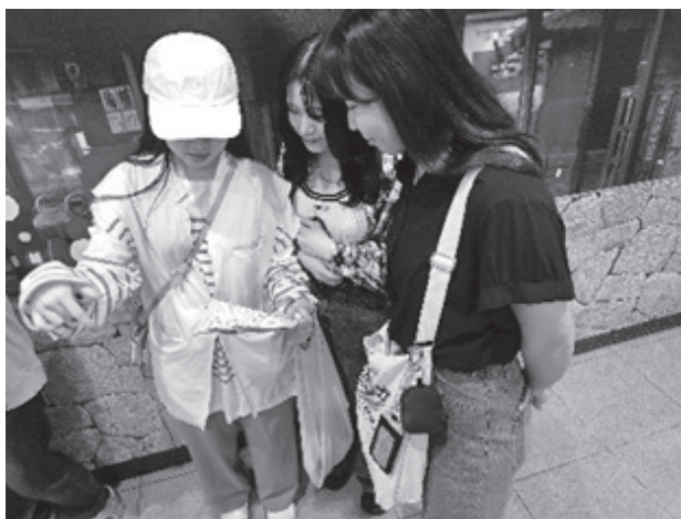
(川越駅に集合し、予定を確認する学生たち)

本実習では前半を八幡信仰や八幡宮に関する歴史的史料、文献購読・川越市の歴史・交通・観光について調べました。また後半では実際に現地での実習になります。まずは川越八幡宮に行き神社神職のお話や参拝者の人数・観光客なのか地元の人なのか、という確認をしました。さらに川越氷川神社や川越熊野神社への見学・比較を通してどのような人が参拝に来ているのか、観光地的な神社と地元住民が参拝する神社では何が違うのか、観光客にとっての神社と、地元の方々が参拝する神社では地域社会・神社・人々はどのような関係を結んでいるのか、を議論しました。