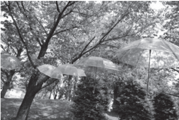
写真3 MACHifes street