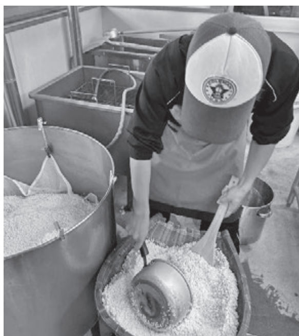
【こんにゃく作り体験(愛林館班)】