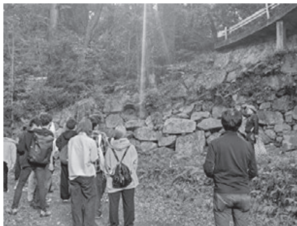
(笠間城跡視察の様子)

午後からは、かさま歴史交流館井筒屋に場所をうつし、笠間稲荷神社前の門前通りの整備および笠間市の文化財である笠間城跡について講義を受けました。東日本大震災が笠間市に及ぼした影響を文化財の視点から考えるとともに、そこからの復興の過程についても学習することができました。