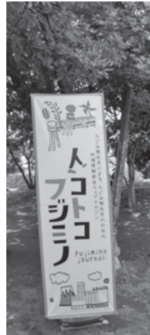
写真4 人コトコ フジミノ

ントに参加する中で、地域の企業・商店や住民の人たちとの接点を持つことができました。また、イベントの企画立案や運営方法を知り、その中で課題を発見し解決策を考えることができました。学生からは、「想像以上に盛り上がった」「少ない時間の中でしっかりと準備できた」「富士見市のおいしいお店を知ることができた」などの声が聞かれました。一方で、「情報共有が課題」「地域の人たちと もっと接したかった」「コミュニケーションが不足していた」などの声も聞かれました。学生が自ら地域の人と接してイベントに関わり、新たな地域資源を見つけることもできました(写真1～写真4)。