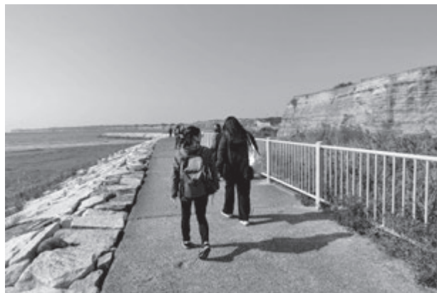
銚子ジオパークの屏風ヶ浦

11月7日(金)は、銚子市を訪問し、銚子ジオパークミュージアム、屏風ヶ浦、犬吠埼、旧公正會館、銚子市役所を訪れました。銚子ジオパークミュージアムでは、ギャラリー、集会所、出張所、子育てルームなどを案内していただきました。また、大正10年に建てられた旧公正會館では、館内を見学しながら、その歴史や利用についてもうかがいました。それぞれの施設での説明に加え、施設