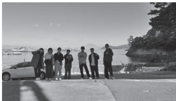
写真5 駿河湾越しの富士山の前に11月実習7名の学生(2025年11月20日)

したがって、各演習・実習で学生たちが見出したテーマが場所を変えて、静岡県松崎町で実践されたと言えます。