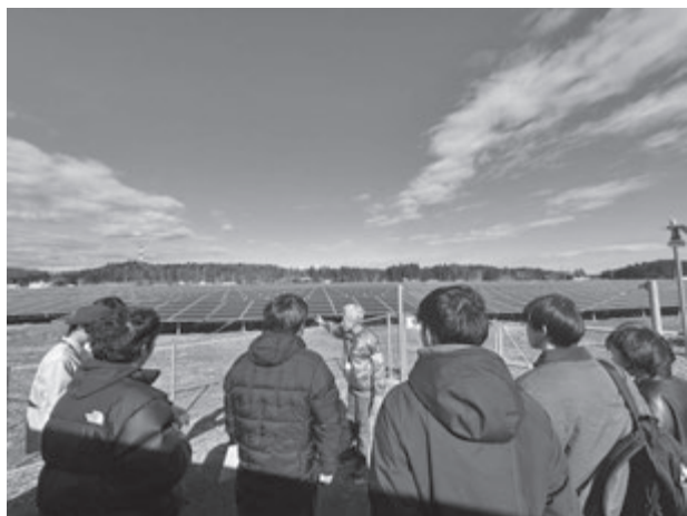
【Fスタディツアーの様子】(学生提供)

初日は湯本駅到着後、街歩きを実施した。温泉神社、童謡館、中央商店街通り、勝行院などを巡り、温泉街としての構造と地域資源を把握した。