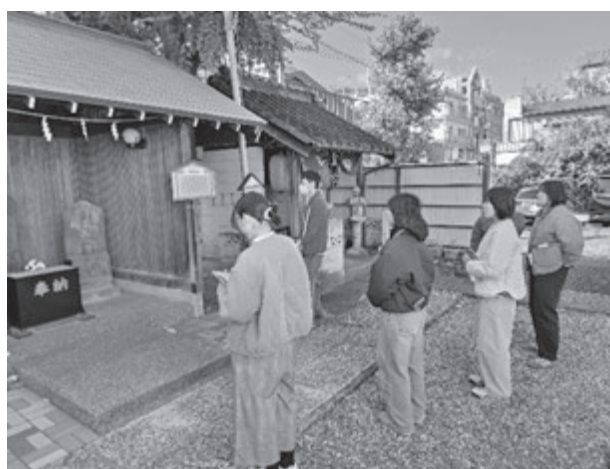
(橋樹神社・宮司による境内案内と説明をうける学生たち)

なっている点について発表しました。グループBは神社と地域の文化活動に注目し、現状の課題と解決策について発表しました。さらに実習後の課題として神社と地域の関係について「よりどころ」をキーワードに設定しレポートの作成を行いました。