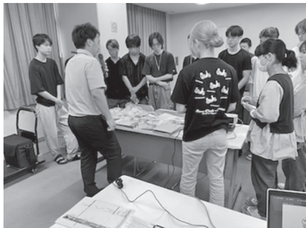
写真2 富士見市危機管理課職員からの授業の様子