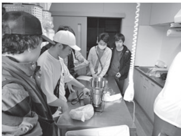
【実習Vの様子(小松菜パウダーの加工場)】

地域理解実習Vでは、地域資源をテーマに、八潮市における農産物の利活用および地域ブランド形成の取り組みについて、現地見学と講義、ワークショップを通じて学ぶことを目的とした。八潮市は都市近郊に位置しながら、小松菜の一大産地として知られており、本実習ではその小松菜を原料とした「小松菜パウダー」に着目した。