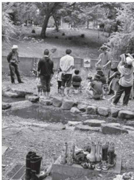
(川遊びと火起こしの様子)