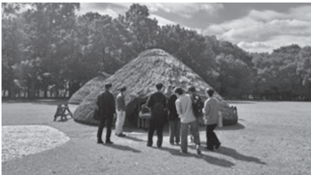
写真6 水子貝塚公園の竪穴住居を見学する学生

また、資料館脇に設置されている展示館では、市民学芸員の方から普段来館者に対して行っているガイドを行っていただきました。