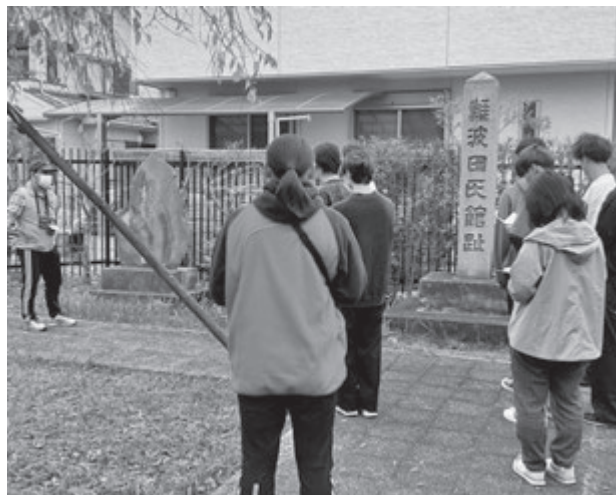
写真7 筆小塚を前に市民学芸員から話を伺う学生

続いて、写真にあるように市民学芸員から城跡ゾーン(難波田城跡)をガイドしていただき、「食い違い小口」「復元木橋」が敵襲に備えた構造になっていることや、難波田城が鎌倉道を見張る役割を果たしたことを教えていただきました。また、事前学習で学んだ江戸時代の寺子屋の師匠を偲んだ弟子が建てた筆子塚(供養塔)を実際に見学しました。