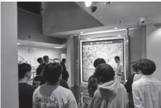
常設展示室内での解説の様子

三芳町の有形・無形の文化財に注目し、その特徴や多様なあり方、文化財の保存・継承に関わる三芳町立