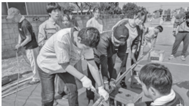
蛇(ジャ)づくりのようす

そこで修祓式や開会式が挙行され、終了すると蛇(ジャ)は順番に神社境内にある弁天池に向かい、「水呑みの儀」