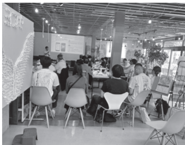
写真1 Area898における自治体視察研修の様子

切に行いつつ、現地での実習を効果的、効率的に進めていくことができるよう、不断の改善プロセスを怠ることなく継続していくことが不可欠であると考えます。