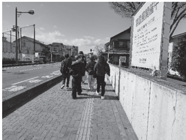
(川越散策をする学生たち)

実習では川越という観光地にとって社寺や美術館という文化施設、食べ歩きできるお店や観光施設など多層的な「場所」があるからこそ、観光地として成り立っている事を学びました。合わせて交通問題（渋滞・騒音・車と人の距離が近い）がある事を身近に実感し、この問題をどう解決すべきなのか、という課題を発見する事ができました。