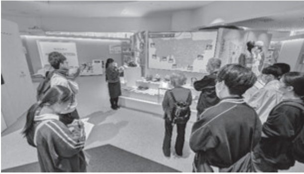
東京電力廃炉資料館の見学