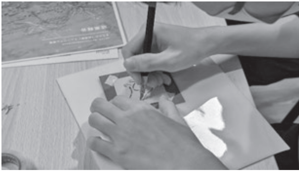
会津型の型彫り体験