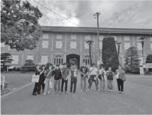
【世界遺産富岡製糸場での記念写真】