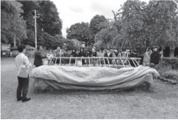
旧島田家住宅前で苗床の説明を受ける様子

バントが行われている様子をご紹介いただきました。講義の後に、三芳町農業センターに隣接する島田家住宅を見学しました。島田家住宅の前にはサツマイモの苗床（踏み込み温床）があり、発酵している落ち葉の上に苗を植え、その熱を利用して育てているとのことでした。その後、上富小学校屋上にご案内いただき、三芳町の地割を見学させていただきました。三芳町の地割の特徴として東西に地割が行われ、土が北風によって飛ぶのを防ぐため、畑の間にお茶の木を植えているとのことでした。