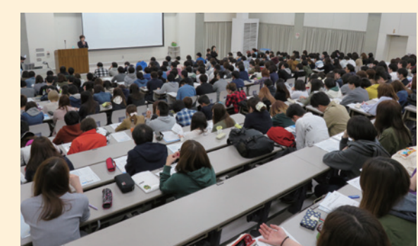
▲キャリアガイダンス