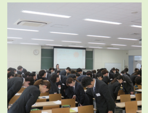
▲社会人マナー講座