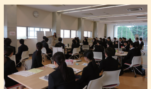
▲インターンシッププログラム