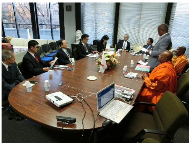
Pic 4 挨拶をするヘラ教授(ペラデニア大学)

来訪した研究者たちは淑徳大学とアジア国際社会福祉研究所に大きな興味を持ち、Facebook等でShukutokuの名前を発信しています。