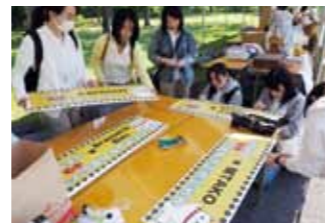
▲店舗に掲げる看板を準備をしています ◀海苔プリンはすぐに完売しました。

5月5日、6日に加會利貝塚内で行われた春祭りに、栄養学科4年生が参加しました。晴天に恵まれた2日間ですが、両日で約1万人の来客で賑わいました。昨年の卒業生が「食による地域創生～海苔消費量増大プロジェクト～」の一環で開発した1つである「ノリノリプリン」も千葉駅5分のところに店舗を構えるBrasserie Bleuさんのご協力のもと、さらにパワーアップ。販売と同時に、即完売いたしました。また、加會利貝塚で非常に多く発掘されている貝「イボキサゴ」に注目し、今