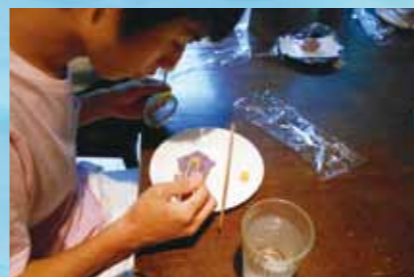
インターンシップ中に体験プログラムが組み込まれており、和菓子作りとお茶の体験をしました。白・紫・黄の餡で桔梗の花を作りました。