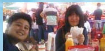
ブラジルでの体験は、私の一生の宝物。帰国後も広い視野をもって勉強に取り組んでいます。