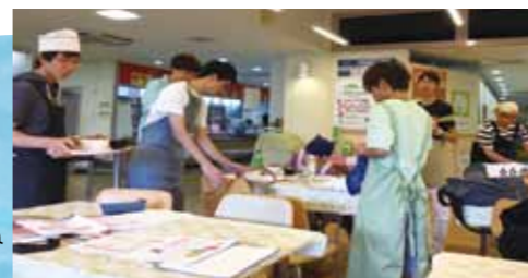
仲間達と改善を重ねた試食会の様子。

接客においても話し合いにおいても、大事なのは相手を思いやること。相手に応じて、どんな説明をすれば分かりやすいか考えることで、互いに有意義な意見を出し合うことができました。