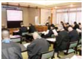
米村教授による講演会▶

校祖・輪島聞声先生は1920年に69歳で入寂され、来年2019年が100回忌となります。この度100回忌を記念して校祖生誕の地、北海道松前郡松前町に顕彰碑を建立いたしました。