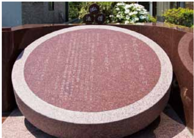
▲松前町に建立した輪島聞声先生の顕彰碑