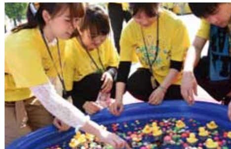
▲子どもたちが楽しめるようにスーパーボールを準備しました。 ◀今年度の参加学生と記念の一枚

ウォーキング」に協賛しています。同時に、学生たちのボランティア参加も3年目になります。救護所では、看護師さんと共にAEDなどの準備を整え、参加者の怪我に対処しました。キッズ緑日コーナーでは、ヨーヨーやスーパーボールすくいの準備や、参加する子どもへの対応