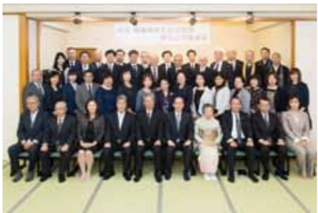
▲除幕式・講演会参列者による記念撮影