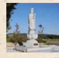
本学園が笠間市に遷座した慈母観音像

【笠間市観光協会ホームページ】 http://www.kasama-kankou.jp/index.html