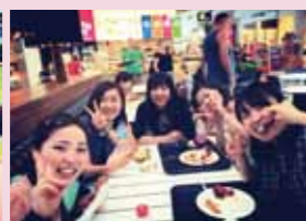
【短期海外研修（オーストラリア研修）】オーストラリアの小学校や大学に行くことができ、小学校では日本語を学ぶ子どもたちの様子も見ることができました。とても貴重な経験ができ、成長できた研修でした。