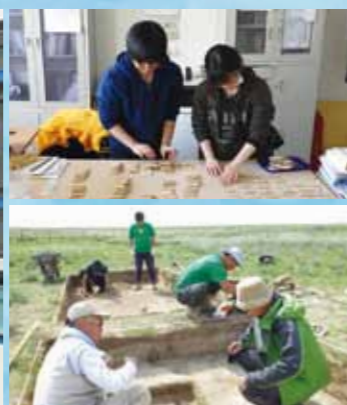
東アジア全体を俯瞰した貨幣流通について調査することができました。