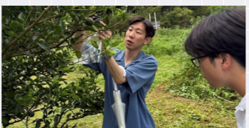
宮崎合宿(日向市 へべす取穫体験)

経営学部観光経営学科3年生(白井ゼミ、永井ゼミ、千葉ゼミ)は、株式会社ソラシドエア(本社・宮崎県宮崎市)および宮崎県7自治体(宮崎県、日向市、高原町、国富町、綾町、西米良村、門川町)、多摩大学が参加する産官学連携プロジェクトを行いました。