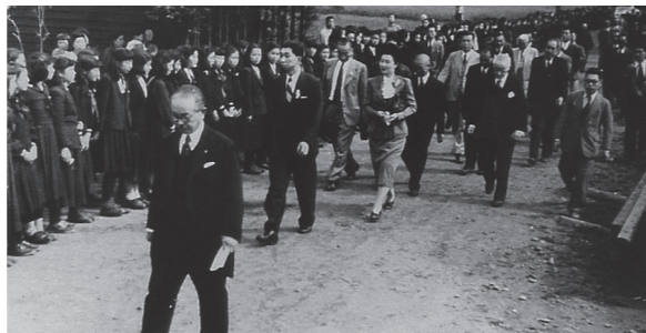
先導する長谷川良信先生

淑徳大学は2025年創立60周年を迎えました。では、1890年(明治23)生まれの学祖・長谷川良信先生が満60歳を迎えた1950年(昭和25)頃、先生はどのような活動をされていたでしょうか。ちなみに、1950年は年齢を数える「満年齢」が採用され、聖徳太子の千円札発行、京都金閣寺の全焼、プロ野球では日本シリーズが始まりました。朝鮮戦争が起きた年でもありました。