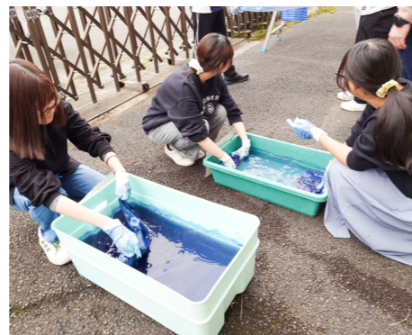
藍染研修を行っている学生たち

第2Qでは八潮市の全体像を捉えこれからの実習に備えます。第3Qでは文化をテーマに町歩きを行い地域社会の変遷や文化を学びます。第4Qでは工場見学や農業体験を通じて地域産業を見ていきます。また2年生第1Qでは八潮市の地域資源である小松菜を中心にその利活用について学びます。2年生第2Qでは学習の最終段階として学生の興味関心に基づき、地域資源をどのように利活用するのか、という点について、八潮市長に対して発表を行います。八潮市について学生は当初「何もないところ」と認識していますが、実習を通し地域の人たちとふれあう中で八潮市は「面白い市」や「文化・産業に特徴がある市」とその認識に大きな変化が見られます。学生が八潮市のファンになる。これが現地実習の持つ大きな教育効果です。