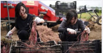
宮崎合宿(国富町 サツマイモ収穫体験)