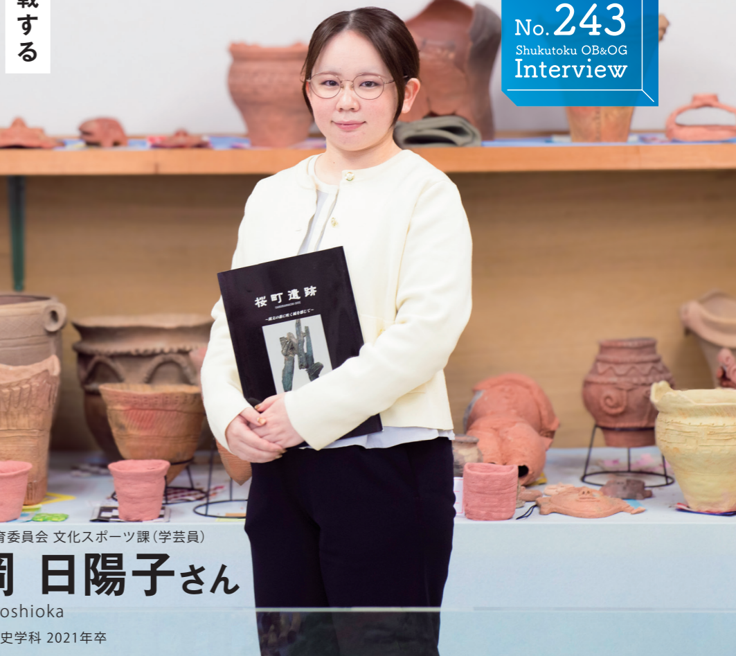
小矢部市教育委員会 文化スポーツ課(学芸員)