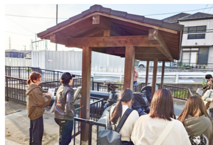
潮止揚水機場史跡の見学と説明を受ける学生たち