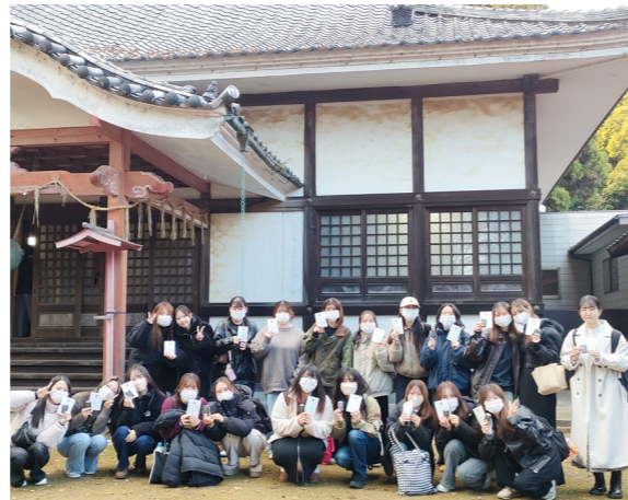
大巖寺の前で集合写真。皆さんいい笑顔です!