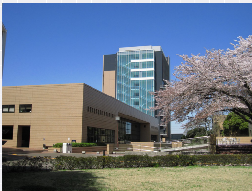
淑徳大学 千葉キャンパス