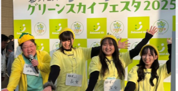
グリーンスカイフェスタ(西米良村PR)

5月の開講式・ソラシドエア特別講義により航空会社の事業や地域連携の意義を学び、8月には宮崎合宿(フィールドワーク)を実施。10月の多摩大学との合同中間発表会を経て、11月には宮崎県主催「日本のひなた宮崎フェス(新宿サザンテラス)やソラシドエア主催「グリーンスカイフェスタ」(二子玉川ライズ)に学