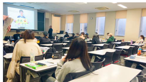
エールの会のおかげで緊張していた気持ちがほぐれ、本番は自己ベストの得点で合格するぞ!

になった先生方からの熱い激励の言葉。これまでくじけそうになっても、学科一丸となって4年生を励ましてきました。加えて合格グッズも受け取って、これで全員合格は確実!そう信じて、4年間見続けてきた管理栄養士の夢を叶えてもらいたいですね。