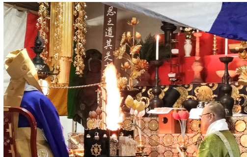
護摩焚きによる祈禱

祈願を終えた学生たちの表情には緊張感とともに前向きな覚悟が感じられ、全員合格に向けてラストスパートに臨む良い節目となりました。