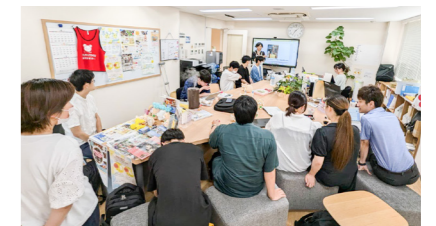
学生たちで賑わっています