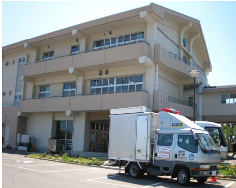
避難所 大須小学校

涌谷町の旅館から 毎朝避難所へ 雄勝病院前で、 必ず手を合わせ、 避難所のトイレ掃除 から一日が始まりま す。 学生の明るく、機敏な 動き、素直さと、周囲への 気配り、すごい淑 徳。 教科書では得られない 精神は、淑徳の伝統と 教え 捨てたもんじゃない 後輩たち かわいらしくて、 うれしくて。