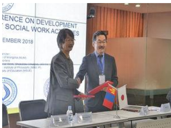
モンゴル国立大学との MOU 調印式は国際シンポジウムの会場で行われました。

仏教ソーシャルワークに関する研究プロジェクトで両大学に協力を依頼したことが今回の協定締結のきっかけとなりました。モンゴル国立大学の哲学・宗教学科とソーシャルワーク学科、並びにモンゴル国立教育大学教育学部ソーシャルワーク学科と手を組んで、共同研究で確かな研究成果をあげたという実績があります。今後、締結された MOU を土台にしながら、仏教ソーシャルワークや国際ソーシャルワークに関する新たな研究をモンゴルの学術機関と共に進めていきます。